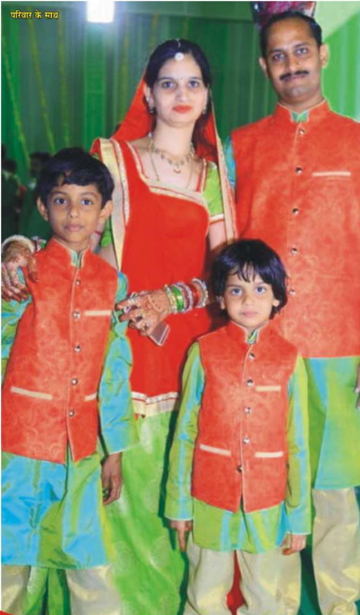
परिवार के साथ