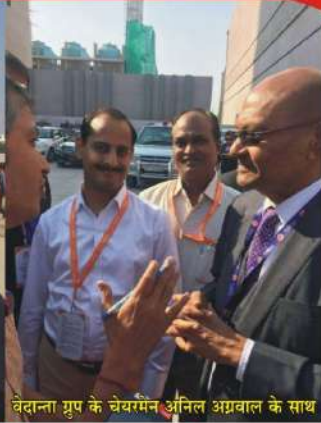
वेदान्ता ग्रुप के चेयरमैन अनिल अग्रवाल के साथ