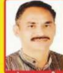
कैदार गगरानी स. मा. मा. महाराष्ट्र