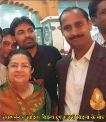
चेयरपर्सन - आदित्य बिड़ला ग्रुप राजश्री बिड़ला के साथ