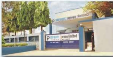
Tarapur Unit - 1 (Commercial & Security Printing)