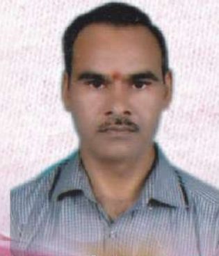
श्रीगणारायण देवीकिशन जी धूत

स्टेट बैंक रोड, वर्धमान प्लाजा, कारंजा ( लाड ) - जिला वाशिम - 444105