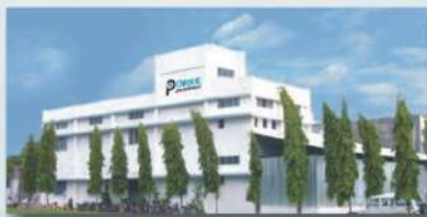
Silvassa Unit - 1 (Printed Carton Division)