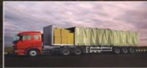
FULL TRUCK LOAD