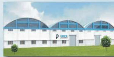
Silvassa Unit - 2 (Books & Stationery Printing)