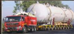
PROJECT CARGO / ODC