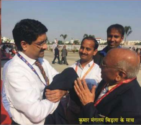
कुमार मंगलम बिड़ला के साथ